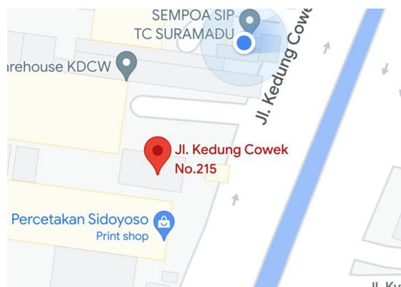
Gambar 2. 2 Lokasi PT. Alfa Viktori Familia

PT. Alfa Viktori Familia terletak di Jalan Muhammad Noer No. 215, Tanah Kali Kedinding, Kenjeran Surabaya, Jawa Timur.