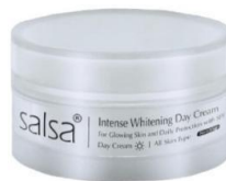
Gambar 2. 7 Produk Salsa Intense Whitening Day Cream

Memiliki keunggulan untuk melindungi kulit dari sinar matahari UVA dan UVB sekaligus mengandung SPF dan BB Cream sehingga wajah menjadi cerah dan glowing sehat merona.