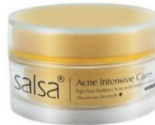
Gambar 2. 9 Salsa Acne Repair Solution Cream

Memiliki keunggulan untuk membantu menyembuhkan permasalahan kulit berjerawat dan beruntusan serta dapat mengatasi kulit kusam dan cocok untuk kulit sensitif.