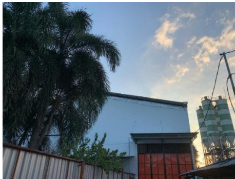
Gambar 2. 11 Lokasi Kedua PT. AVF