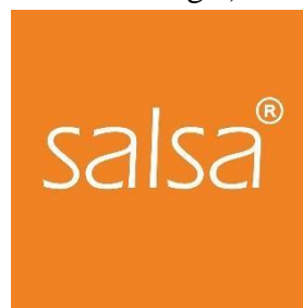
Gambar 2. 2 Logo Salsa Cosmetics