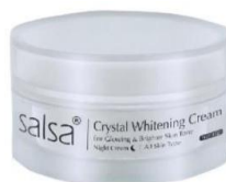
Gambar 2. 8 Salsa Crystal Whitening Cream

Memiliki keunggulan untuk meregenerasi sel kulit, memudahkan flek hitam, mencerahkan wajah lebih cepat, dan dapat menutrisi kulit hingga lapisan terdalam.