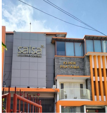
Gambar 2. 10 Lokasi Pertama PT. AVF