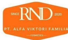
Gambar 2. 12b Logo Departemen Research and Development PT. AVF