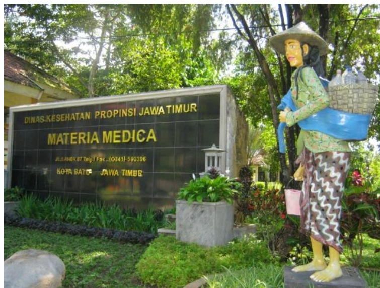
Gambar 2.1 Materia Medica Batu

UPT Laboratorium Herbal Materia Medica Batu merupakan Unit Pelaksanaan Teknis (UPT) yang bekerja dibawah organisasi induk yaitu Dinas Kesehatan Provinsi Jawa Timur untuk mengerjakan tugas-tugas penunjang dan teknis dari bidang herbal. Unit-unit yang ada di UPT Laboratorium Herbal Materia Medica Batu adalah Gedung Kantor, Perpustakaan, Aula, Kebun Tanaman Obat, Green House , Unit Budidaya Tanaman Obat, Laboratorium Kultur Jaringan, Unit Pengolahan Pasca Panen Tanaman Obat, Laboratorium Diversifikasi Produk, Laboratorium Fitokimia, Laboratorium Instrumen, Laboratorium Mikrobiologi, Griya Sehat, Herbal Mart dan Musholah (MMB, 2023).