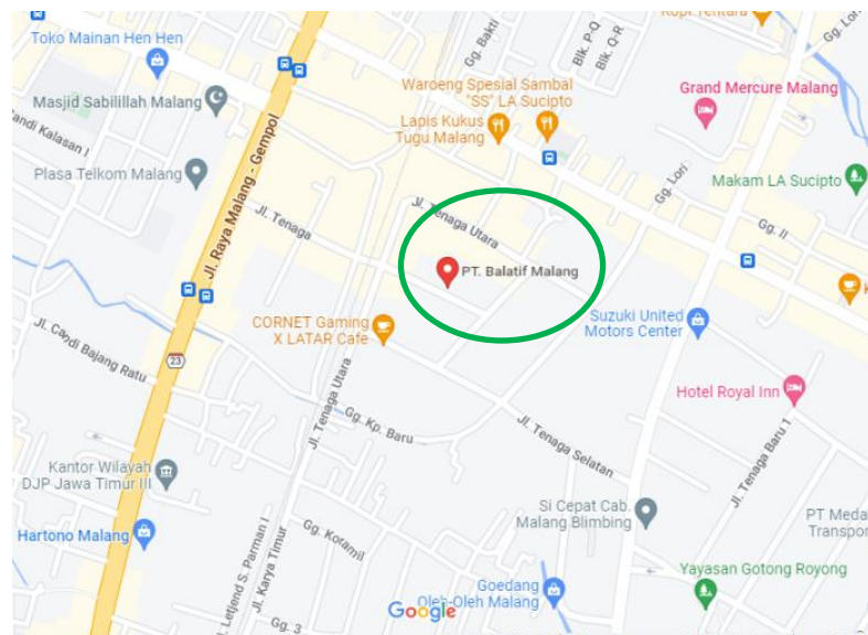
Gambar 2.2 Lokasi PT Balatif

PT. Balatif beralamat di jalan Tenaga Tengah No. 5, Malang Terletak di kawasan industri makanan dan minuman sehingga dapat meminimalkan resiko kontaminasi serta polusi dari lingkungan. Di sisi kanan, kiri, dan belakang PT.