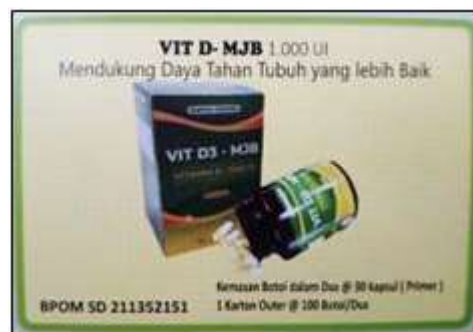
Gambar 2.6 Produk Vitamin D PT. MJB Pharma