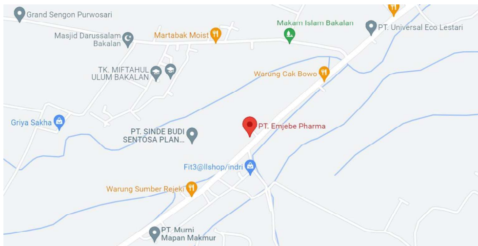
Gambar 2.4 Peta Lokasi PT. MJB Pharma

PT MJB Pharma berlokasi di jalan Babatan Km 4, Desa Bakalan, Kecamatan Purwosari, Kabupaten Pasuruan, Jawa Timur 67162.