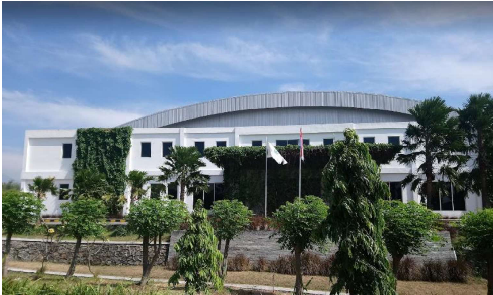
Gambar 2.5 Gedung Utama PT. MJB Pharma

Berikut merupakan Gedung Utama PT. MJB Pharma