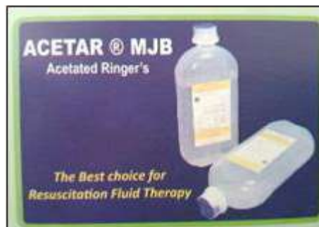
Gambar 2.2 Produk Infus Acetar PT. MJB Pharma