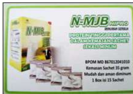
Gambar 2.2 Produk Susu Protein PT. MJB Pharma