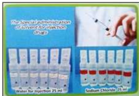
Gambar 2.3 Produk Ampul PT. MJB Pharma