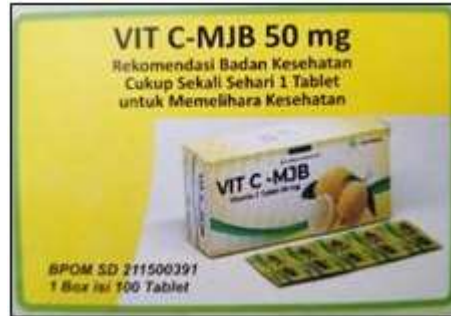
Gambar 2.4 Produk Vitamin C PT. MJB Pharma