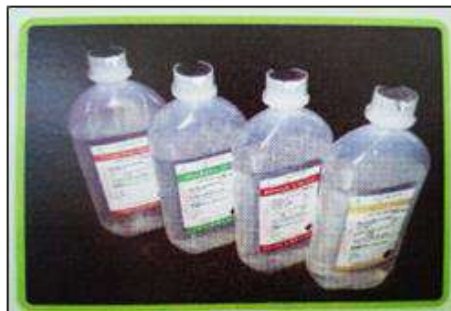
Gambar 2.1 Produk Infus PT. MJB Pharma

adalah infus Sodium Chloride , Ringer Laktat, Dextrose Monohydrate , Detrose Monohydrate Sodium Chloride , dan Acetar. Untuk produk ampul yang diproduksi oleh PT MJB Pharma adalah ampul Water for Injection dan Sodium Chloride . Selain memproduksi untuk dalam negeri, PT MJB Pharma juga melakukan ekspor produk ke negara Kamboja dan Timor Leste. Selain melakukan ekspor, PT MJB Pharma juga memproduksi vitamin C, vitamin D, dan N-MJB (susu protein tinggi) untuk meningkatkan kualitas hidup masyarakat selama masa pandemi COVID-19 berlangsung.