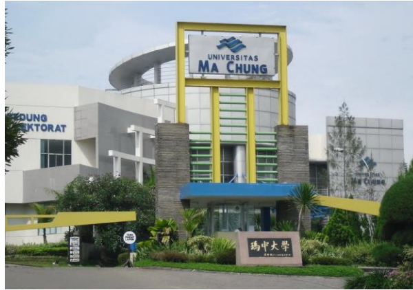
Gambar 2.3 Universitas Ma Chung Tampak Depan