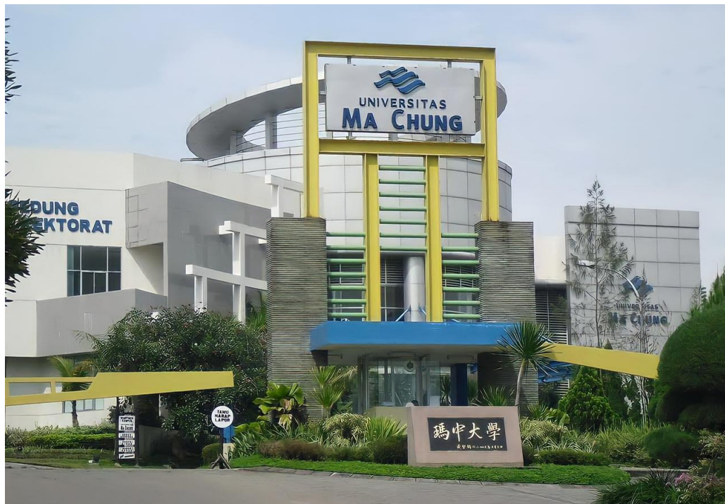
Gambar 2. 4 Tampak Depan Universitas Ma Chung