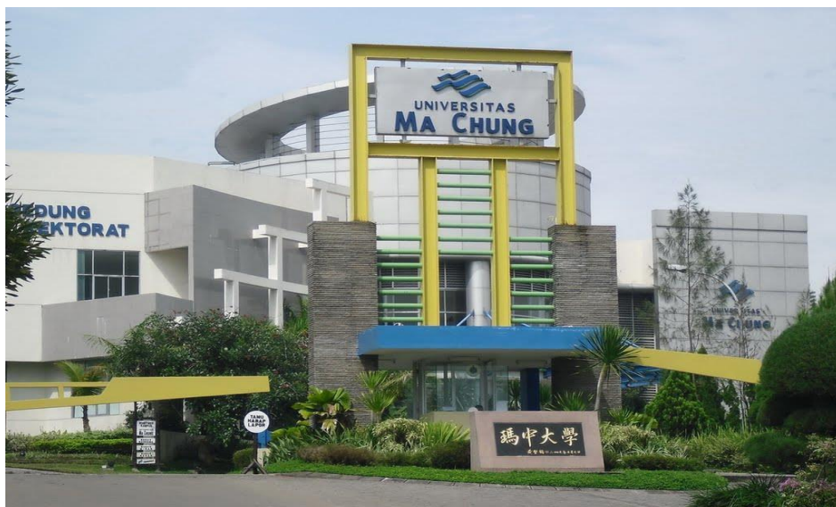
Gambar 2. 4 Lokasi Universitas Ma Chung