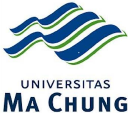
Gambar 2. 1 Logo Universitas Ma Chung

Arti dari logo Universitas Ma Chung yaitu, logo ini terdiri dari tiga bentuk gelombang air yang menunjukkan dasar dari Universitas Ma Chung yaitu Tri Dharma Perguruan Tinggi. Panjang pendeknya gelombang mengekspresikan urutan sistem dari pengajaran dan penelitian sampai ke pengabdian pada masyarakat. Tiga bentuk gelombang tersebut merupakan satu kesatuan bentuk gunung yang menggambarkan dan mewakili alam dan sumber daya alam Indonesia, serta secara khusus menunjukkan karakter Malang yang berada di daerah pegunungan. Universitas Ma Chung menjadi mercusuar pendidikan di daerah sekitarnya. Lambang gelombang air itu memiliki filosofi positif bagi kehidupan manusia. Warna biru menunjukkan air sebagai sumber kehidupan. Warna hijau mewujudkan kekayaan alam Indonesia yang beraneka ragam dan berada dalam keselarasan. Logo ini secara keseluruhan menunjukkan bahwa Universitas Ma Chung adalah institusi yang dinamis dan mampu menyesuaikan diri dengan tuntutan jaman serta menjadi sumber ilmu pengetahuan berbasis sumber daya alam yang unggul dan mampu menjadi pemuas dahaga bagi mereka yang haus akan ilmu pengetahuan.