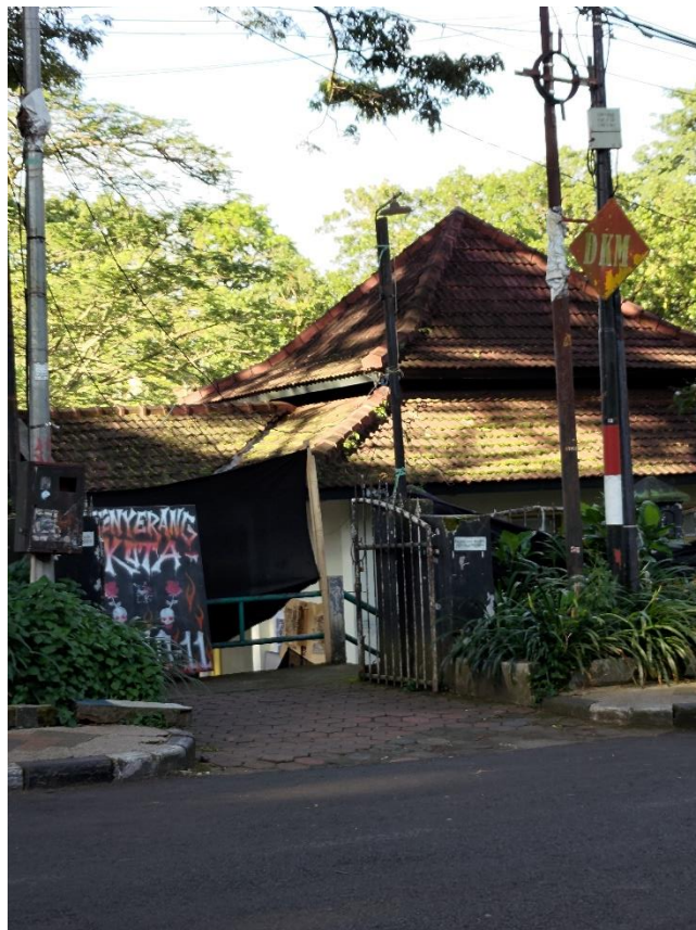
Foto 2. 1 Foto Kantor Dewan Kesenian Malang

Nama komunitas : Dewan Kesenian Malang (DKM) Alamat : Jl. Majapahit No.3, Kauman, Kec. Klojen 65119 Email : lembagasenikotamalang@gmail.com Telepon : +62 838-3452-0500