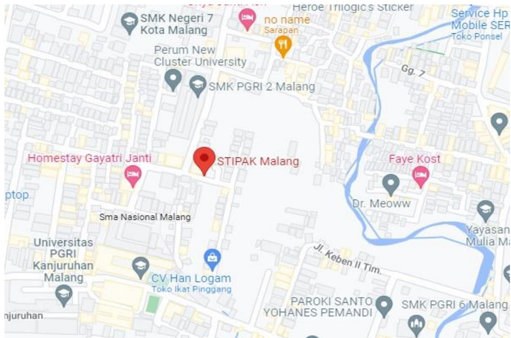
Gambar 2. 2 Lokasi Sekolah Tinggi Pendidikan Agama Kristen Malang