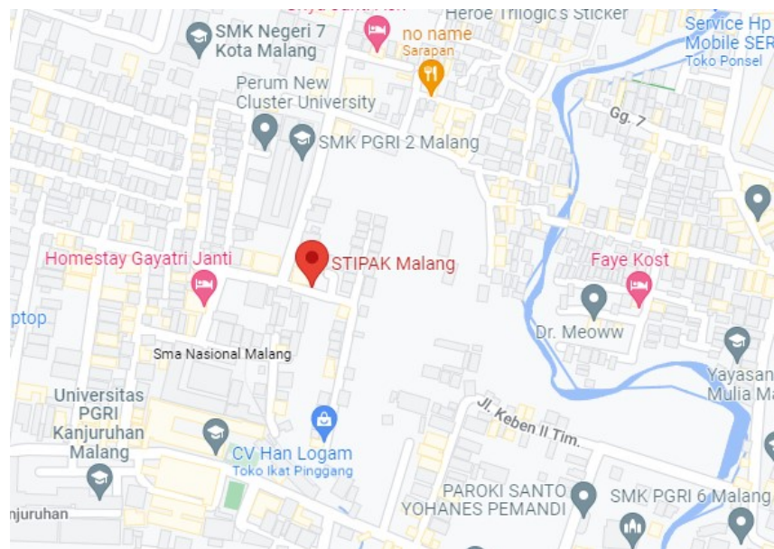
Gambar 2. 2 Lokasi Sekolah Tinggi Pendidikan Agama Kristen (STIPAK) Malang