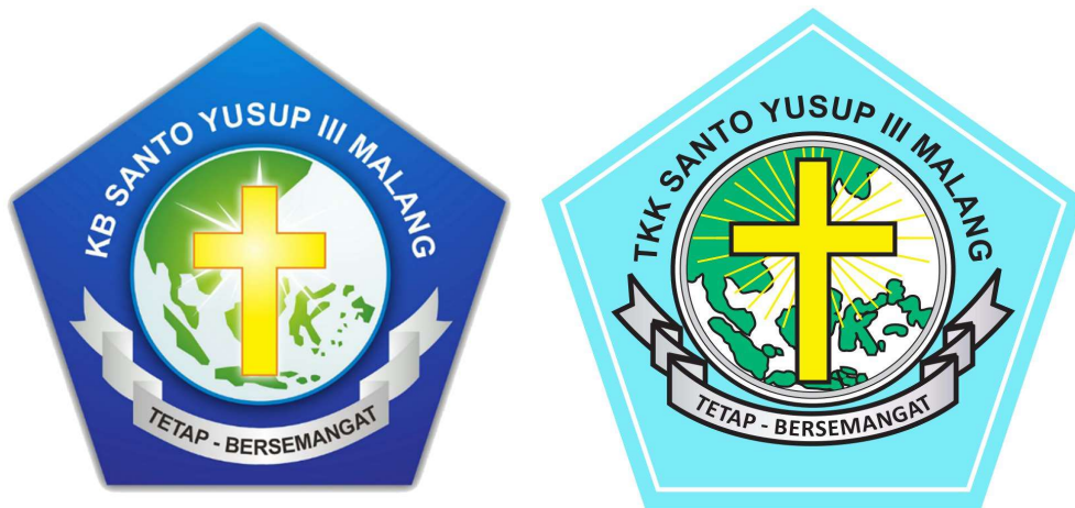
Gambar 2.2 Logo KB dan TKK Santo Yusup 3 Malang

Logo KB dan TKK Santo Yusup 3 Malang serta seluruh logo sekolah yang berada di bawah naungan Yayasan Kolese Santo Yusup memiliki komponen yang hampir sama yaitu pada gambar salib, peta Indonesia, dan semboyan “TETAP – BERSEMANGAT” dengan variasi pada nama sekolah dan warna yang menyesuaikan warna khas setiap sekolah, hal itu menunjukkan penurunan visi dan misi yang sama dari yayasan pada setiap sekolah di bawah naungannya dengan tetap memiliki kekhasan tersendiri dalam pelaksanaannya di masing-masing sekolah.