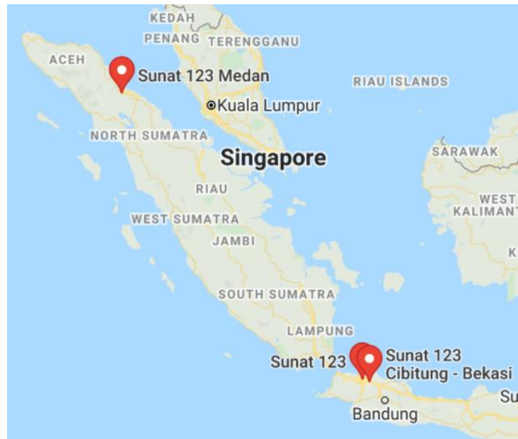
Gambar 2. 3 Peta Letak Klinik

Saat ini Sunat 123 memiliki tiga Klinik Sunat :