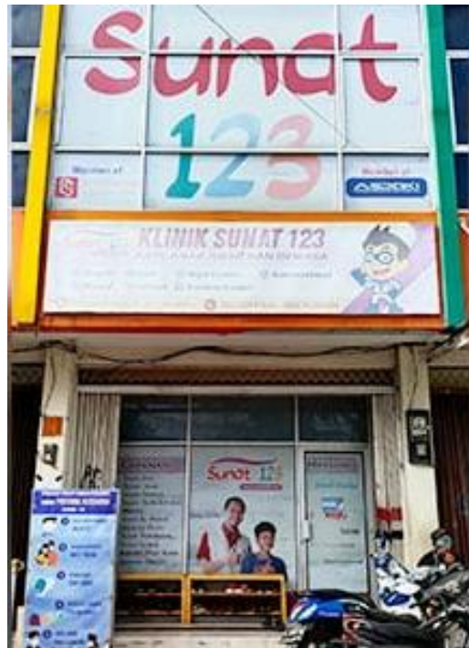
Gambar 2. 2 Tampak Depan Klinik

Sunat 123 merupakan Klinik khusus yang memberikan pelayanan khitan yang menasar kelompok masyarakat menengah ke atas. Klinik melayani berbagai metode khitan termutakhir yang dapat dilakukan dengan anestesi lokal dan di pelayanan pratama.