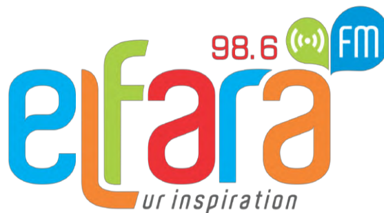
Gambar 2.3 Logo radio Elfara