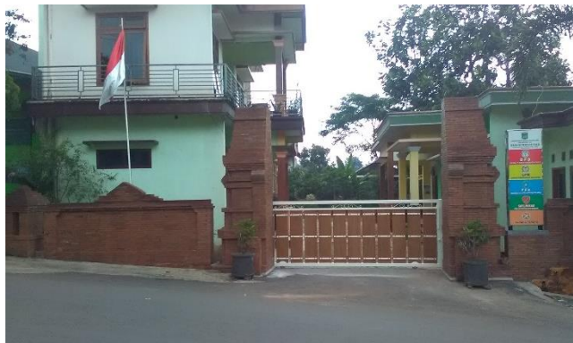
Gambar 2. 1 Kantor Desa Sumber Sekar

Desa Sumber Sekar memiliki letak geografis pada posisi 7^{\circ} 55' 14,7'' lintang selatan dan 112^{\circ} 33' 59,7'' bujur timur dan terletak di Kecamatan Dau, Kabupaten Malang. Desa Sumber Sekar memiliki posisi wilayah yang berbatasan dengan Desa Dadaprejo, Kecamatan Junrejo dan Kota Batu di arah utara dan barat, Desa Gedungkulon di arah selatan, dan Desa Mulyoagung di arah timur. Desa Sumber Sekar terbagi menjadi 4 dusun diantaranya Semanding, Krajan dan Precet yang dibagi lagi menjadi 7 Rusun Warga dan 30 Rusun Tangga. Desa Sumber Sekar memiliki jumlah penduduk 7.479 penduduk yang terbagi menjadi 2.430 Kepala Keluarga dengan 3.752 laki – laki dan 3.727 perempuan. Gambar 2.1 merupakan gambar Kantor Desa Sumber Sekar.