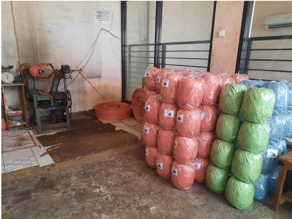
Gambar 4 Mesin produksi untuk tali rafia