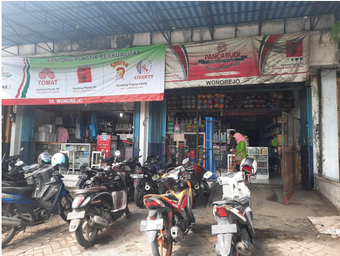
Gambar 3 Tampak depan perusahaan