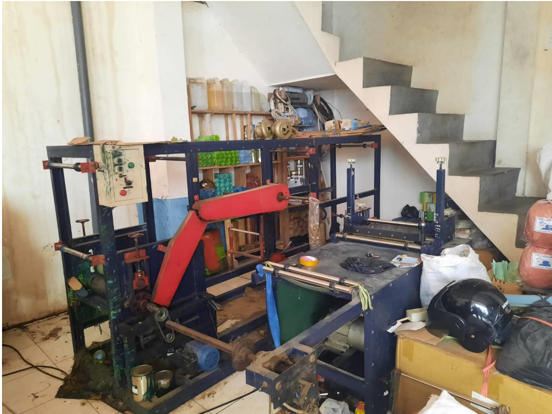
Gambar 5 Mesin untuk memproduksi produk plastik