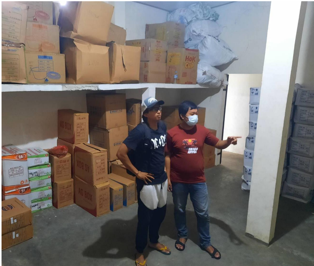
Gambar 6 Gudang UD. Wonorejo