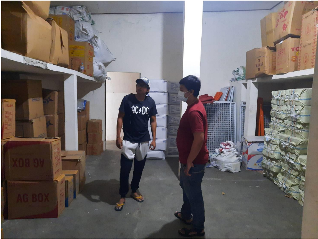
Gambar 7 Gudang UD. Wonorejo