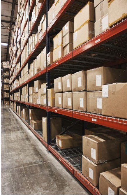
Figure 3 Gudang Cv. Anugerah Karya