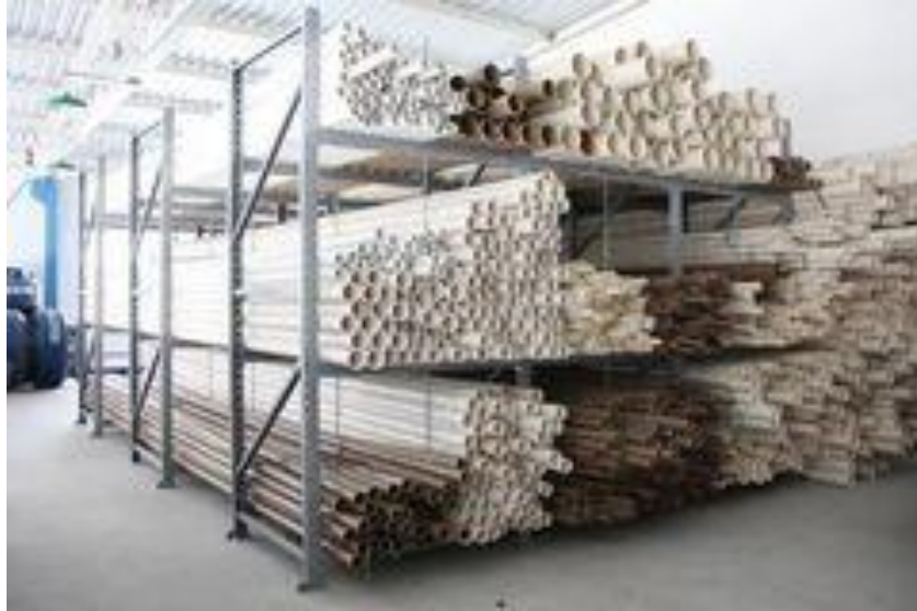
Figure 4 Cv. Anugerah Karya