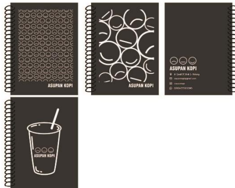
Gambar 5.11 Karya Pendukung Note Book