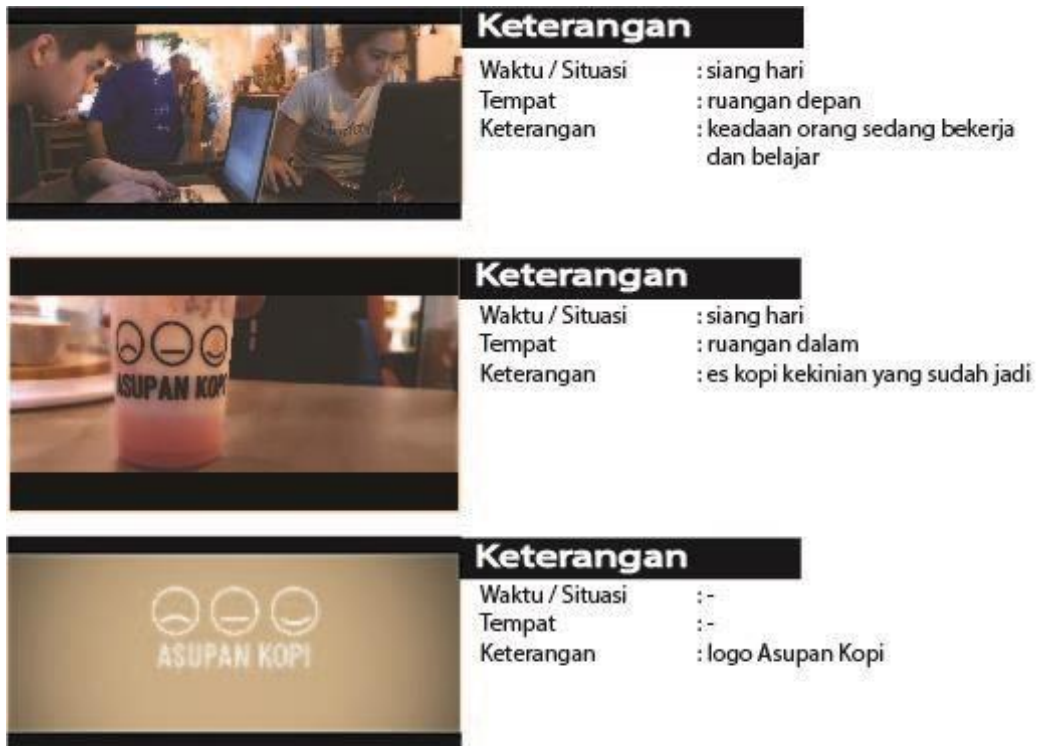
Gambar 5.7 Scene Sequence Preview Video 1g