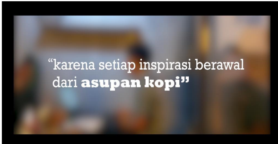
Gambar 5.10 Scene Sequence Preview Video 4