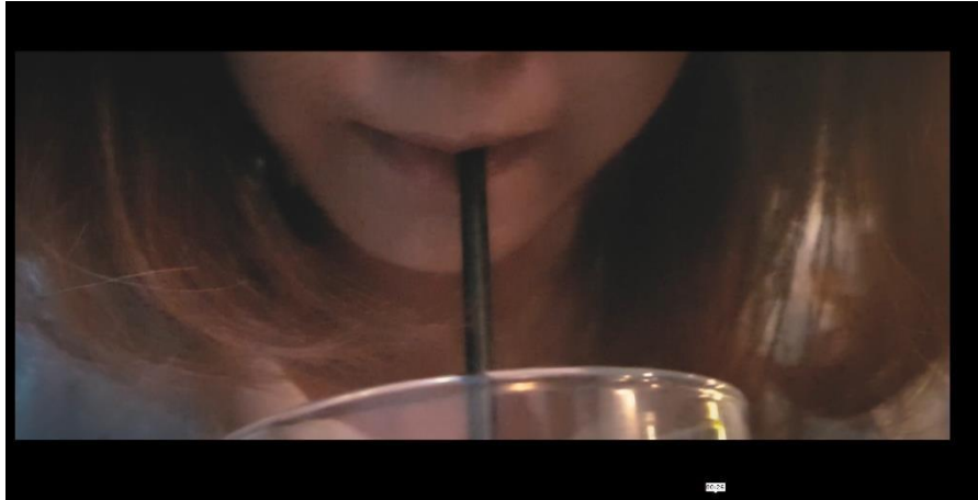
Gambar 5.9 Scene Sequence Preview Video 3