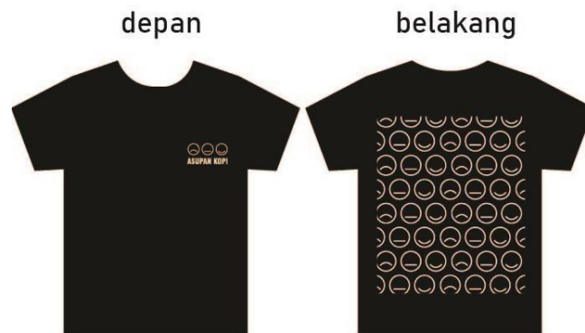
Gambar 5.13 Karya Pendukung T-Shirt