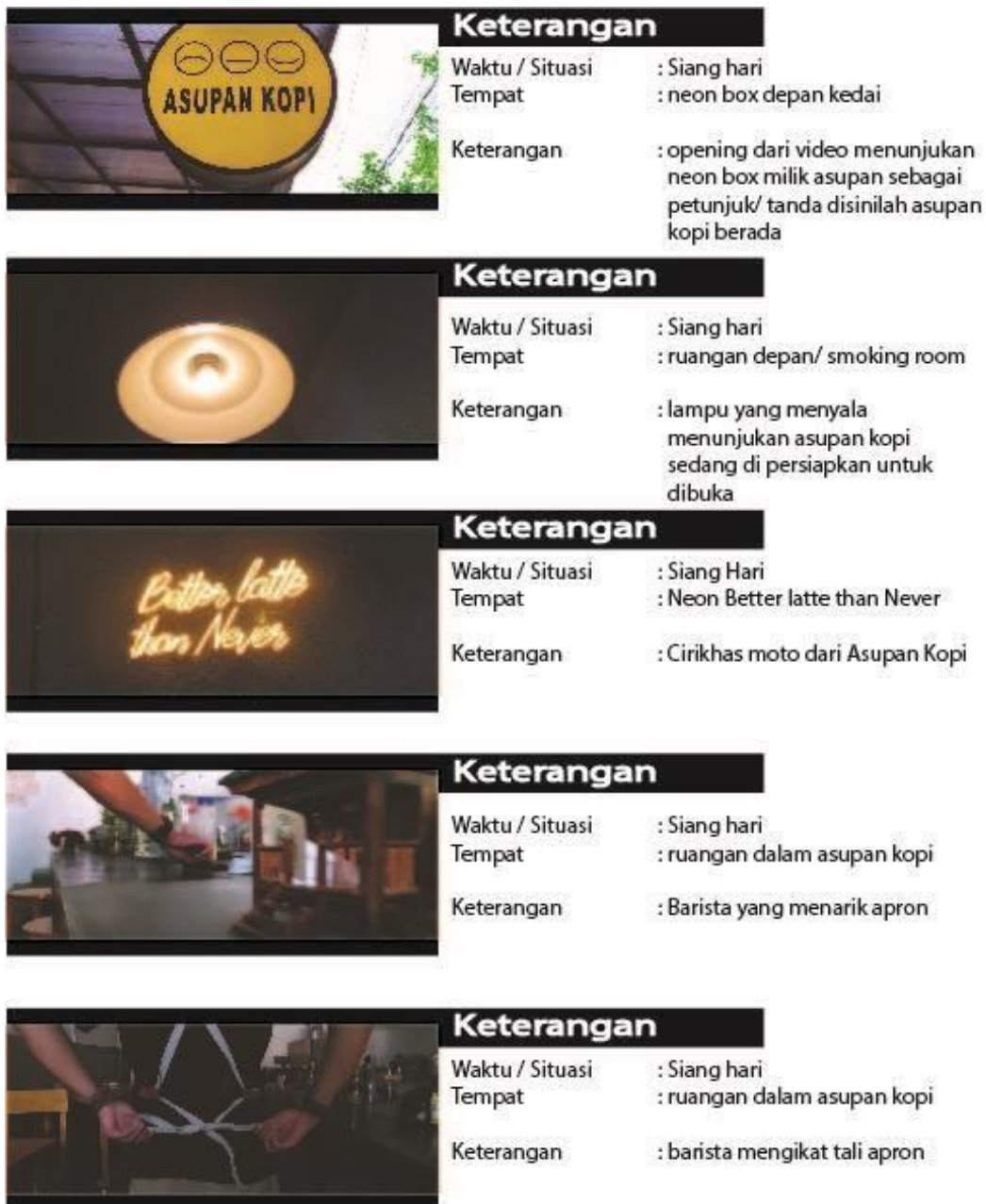
Gambar 5.1 Scene Sequence Preview Video 1a