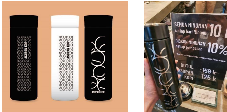
Gambar 5.12 Karya Pendukung Botol Tumbler