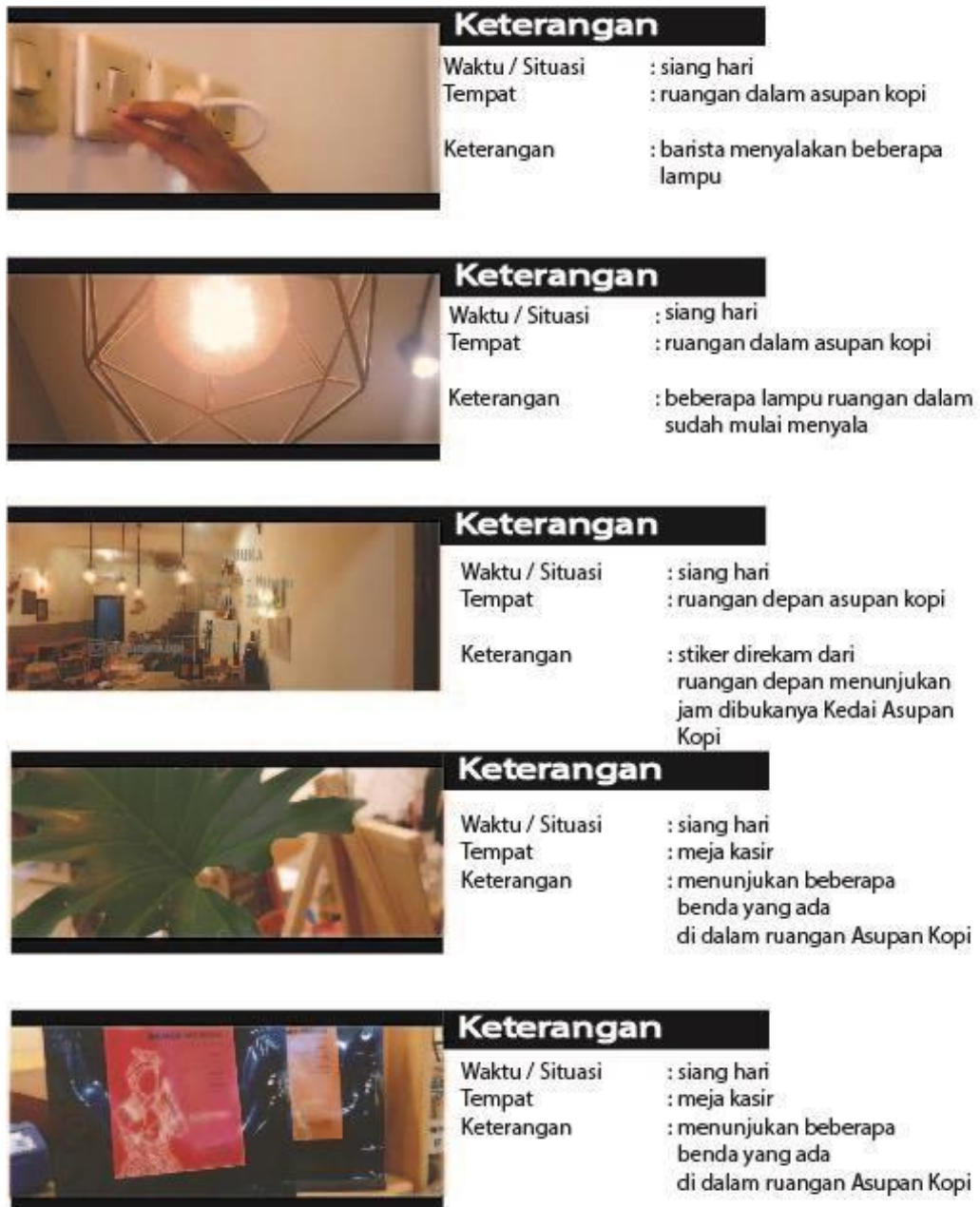
Gambar 5.2 Scene Sequence Preview Video 1b