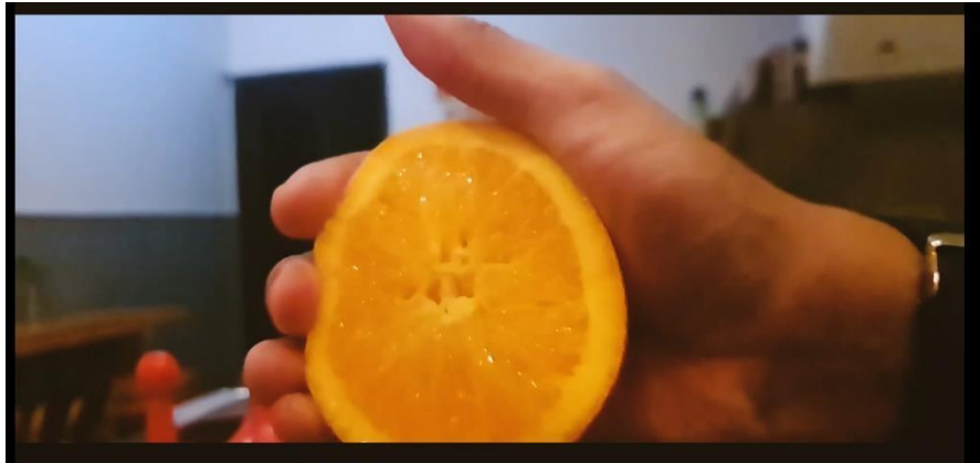
Gambar 5.8 Scene Sequence Preview Video 2