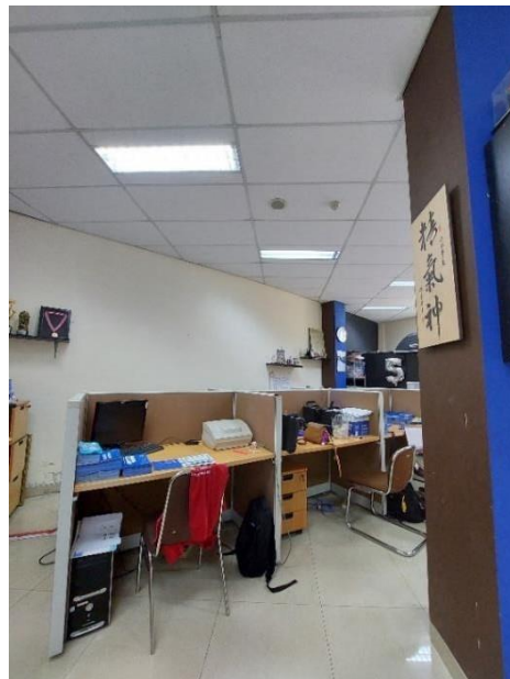
Gambar 2. 4 Ruang Kantor Pemasaran dan Humas