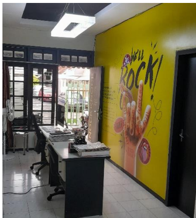
Gambar 2. 8 Ruang Tengah dan Kursi Pemilik Mickey Mouse Advertising