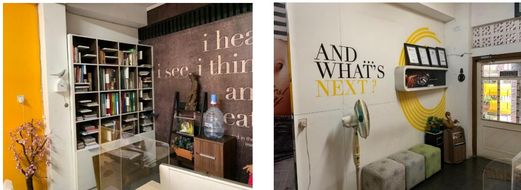
Gambar 2. 7 Rak Buku Desain dan Ruang Tunggu Client Mickey Mouse Advertising