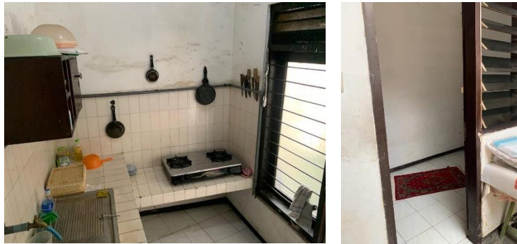
Gambar 2. 10 Dapur dan Ruang Sholat Mickey Mouse Advertising