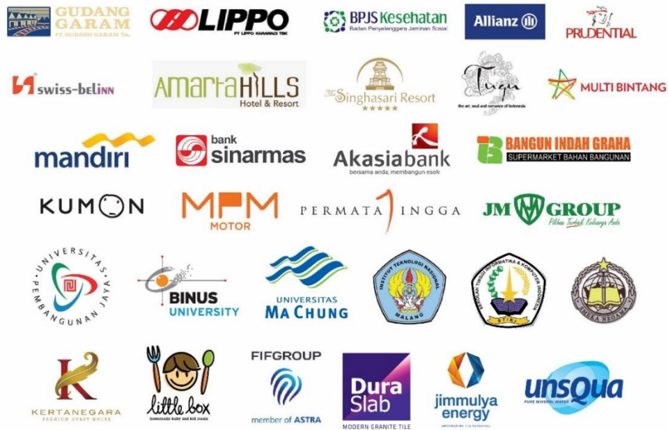
Gambar 2. 3 Client Perusahaan