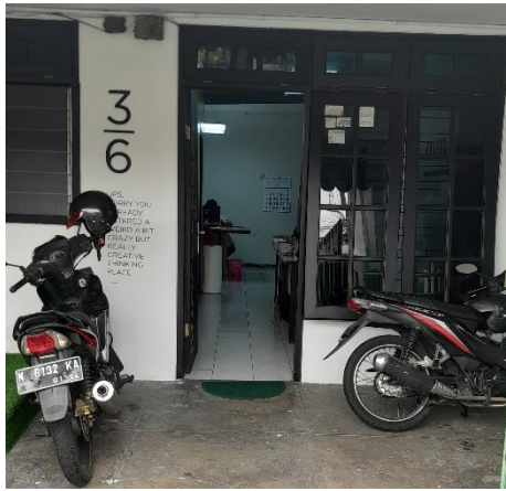
Gambar 2. 6 Area Parkir Mickey Mouse Advertising