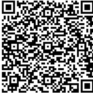
Gambar 2. 5 QR Code Peta Lokasi Perusahaan