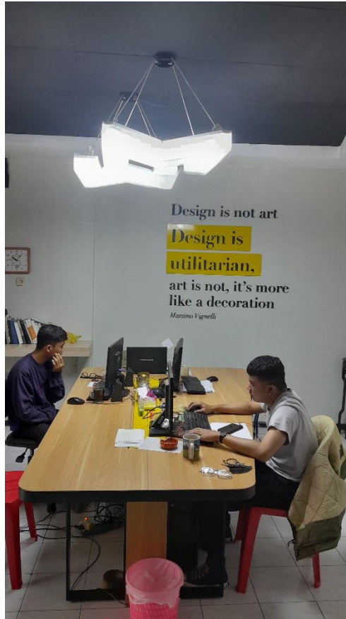
Gambar 2. 9 Ruang Kerja Mickey Mouse Advertising