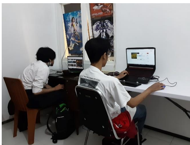
Gambar 2.6 Ruang Pengerjaan di MICA

MICA memiliki beberapa fasilitas yang dapat mendukung dalam pengerjaannya. MICA memiliki WiFi yang dapat membantu dalam mencari referensi serta menghubungkan pendiri dengan klien. MICA juga memiliki ruang khusus untuk mengerjakan permintaan dari klien.