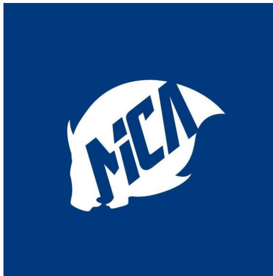
Gambar 2.1 Logo Studio