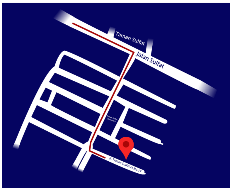
Gambar 2.5 Lokasi Studio MICA