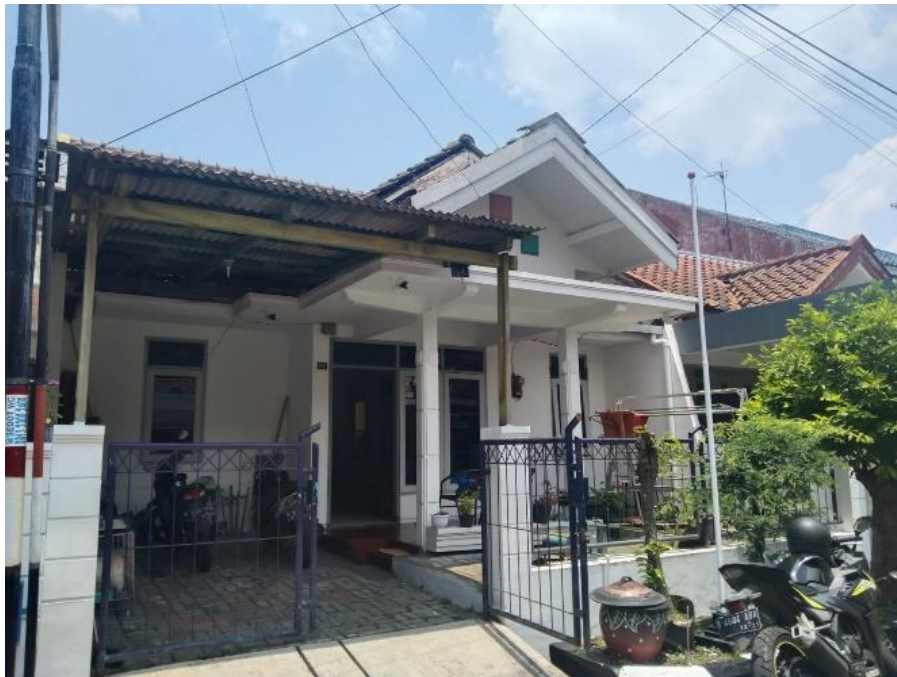
Gambar 2.4 Tampang Depan Studio MICA