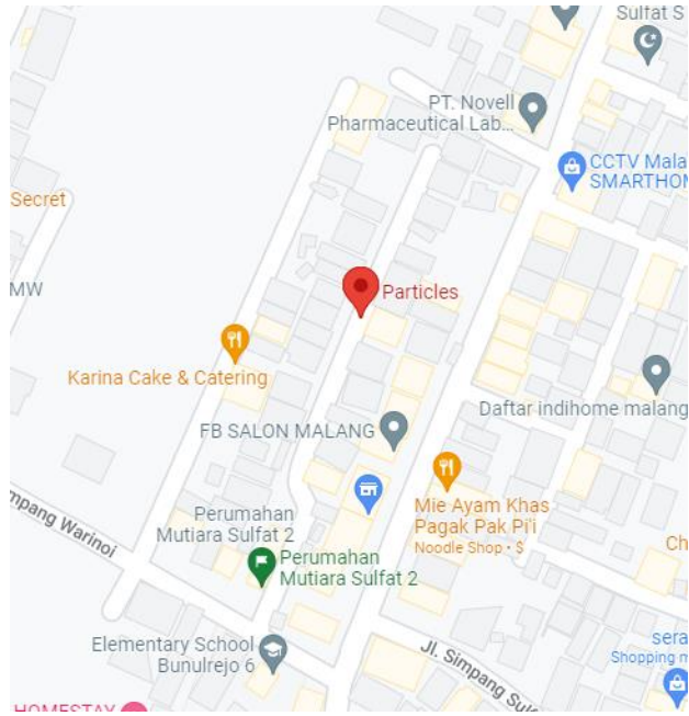
Gambar 2.3 Lokasi Particles Studio