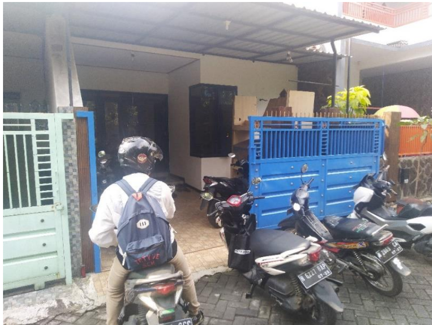
Gambar 2.4 Tampak Depan Particles Studio

Pada gambar 2.4 dibawah ini menunjukkan tampak depan dari Particles Studio yang mana juga menjadi tempat parkir staff-staff yang bekerja di Particles Studio.