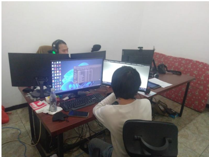
Gambar 2.6 Ruang Kerja Supervisor Particles Studio

Pada gambar 2.6 dibawah ini menunjukkan ruangan yang menjadi tempat kerja dari staff lead artist dan lead texture artist