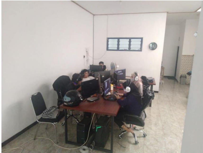
Gambar 2.5 Ruang Kerja Staff Particles Studio

Pada gambar 2.5 dibawah ini menunjukkan ruangan yang menjadi tempat kerja dari staff junior 3D artist dan senior 3D artist .