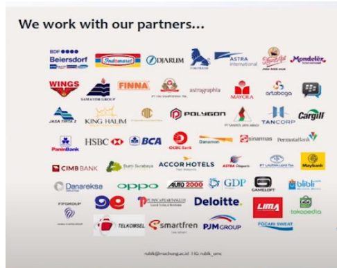
Gambar 2.1 Mitra kerjasama RUBIK