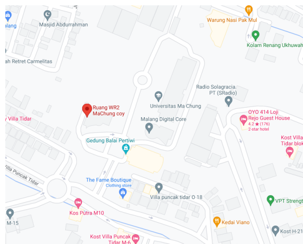
Gambar 2.4 Lokasi RUBIK

Lokasi RUBIK terletak di Villa Puncak Tidar N-01 Malang 65151 Jawa Timur – Indonesia