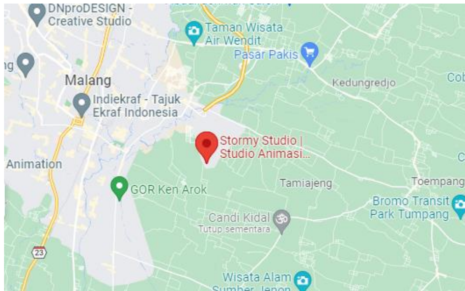
Gambar 2.3 Lokasi Stormy Studio

Lokasi Stormy Studio terletak di Jl. Eltari II VA-2, Cemorokandang, Kedungkandang, Kota Malang, Jawa Timur, 65138, Indonesia.