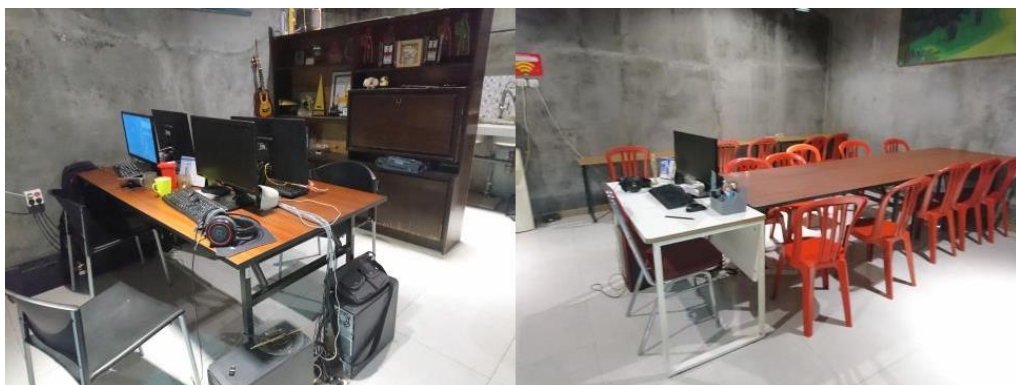
Gambar 2.5 Ruang Kerja Stormy Studio