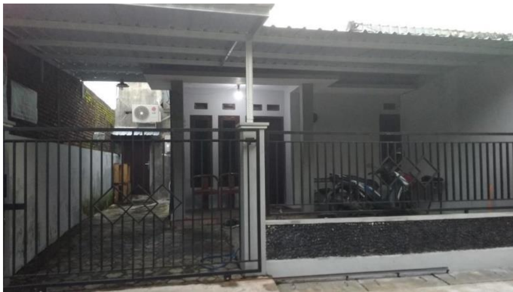
Gambar 2.4 Tampak Depan Stormy Studio