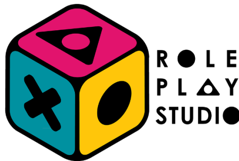
Gambar 2.1. Logo perusahaan