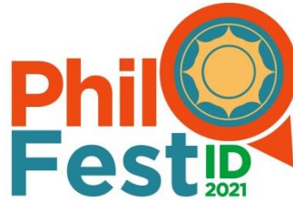
Gambar 2.1 : Logo Perusahaan