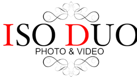
Gambar 2.1 Logo Perusahaan ISO DUO