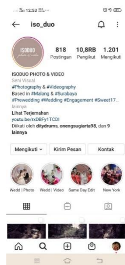
Gambar 2.4 Instagram ISO DUO