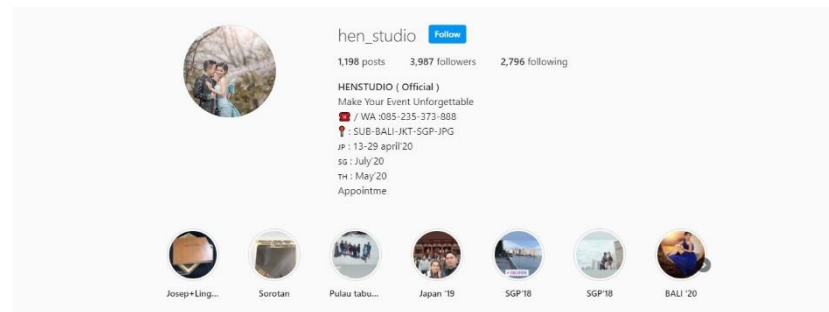
Gambar 2.4 Akun Instagram Perusahaan