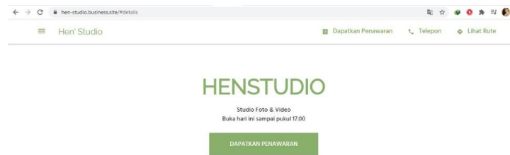
Gambar 2.3 Website Perusahaan

Website https://henstudio.business.site/#gallery