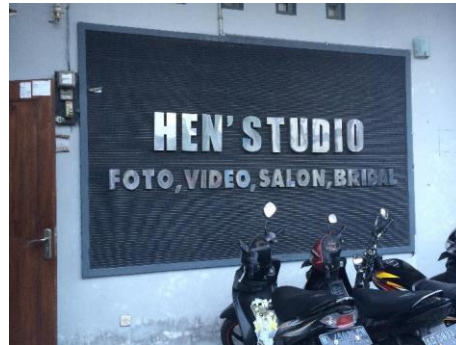
Gambar 2.1 Hans Studio