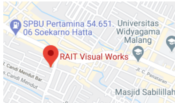
Gambar 2.4 Peta RAIT Visual Works

Kantor sekaligus studio RAIT Visual Works berada di Jalan Sukarno Hatta Indah III No. 11, Kota Malang, Jawa Timur, Indonesia.