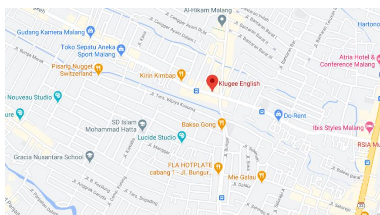
Gambar 2. 3 Lokasi Perusahaan Klugee

Lokasi Klugee terletak di Jl. Kalpataru No.24, Jatimulyo, Kec. Lowokwaru, Kota Malang, Jawa Timur 65141, Indonesia.