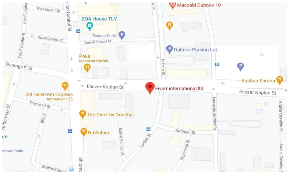
Gambar 2.3 Lokasi Perusahaan Fiverr