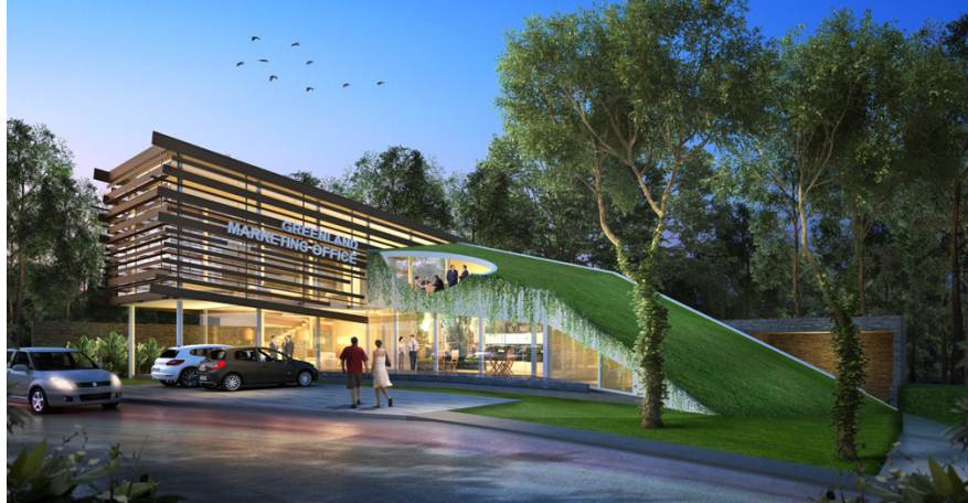
Gambar 2.2 Penampakan Kantor Marketing Greenland Tidar