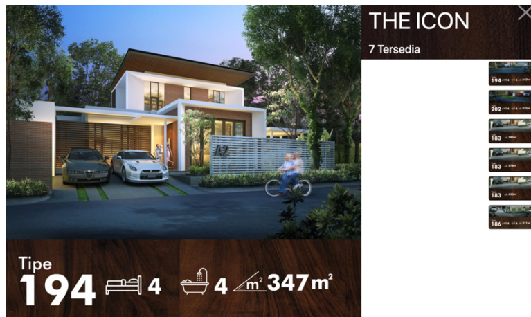
Gambar 2.10 Penampakan Produk Greenland The Icon

Pembangunan the icons adalah pembangunan rumah yang terletak di jalan utama. Berada di blok A, dengan luas bangunan 194 dan luas tanah 348 \text{ m}^2 . Untuk bangunan di blok A ini design bisa menyesuaikan dengan keinginan user (konsumen). Selain itu ada juga dengan luas tanah 355 \text{ m}^2 dengan luas bangunan 202. Sedangkan luas tanah 312 \text{ m}^2 luas bangunannya 186. Dan yang paling besar dengan luas tanah 473 \text{ m}^2 dan luas bangunannya 214. Untuk semua pembelian unit di Greenland at Tidar ini sudah mendapatkan fasilitas sertifikat atas nama pembeli, PLN, air bersih, IMB, PPN tanah dan bangunan, pagar keliling, dan taman depan. Untuk proses KPR sendiri, Greenald sudah memiliki kerjasama dengan beberapa bank, yaitu BCA, Mandiri, BII, BTN, dll. Proses pembangunan setiap rumah juga berbeda-beda. Untuk rumah dengan satu lantai bias memakan waktu antara 8 sampai 12 bulan, sedangkan untuk proses pembangunan rumah dua lantai antara 12 sampai 18 bulan.