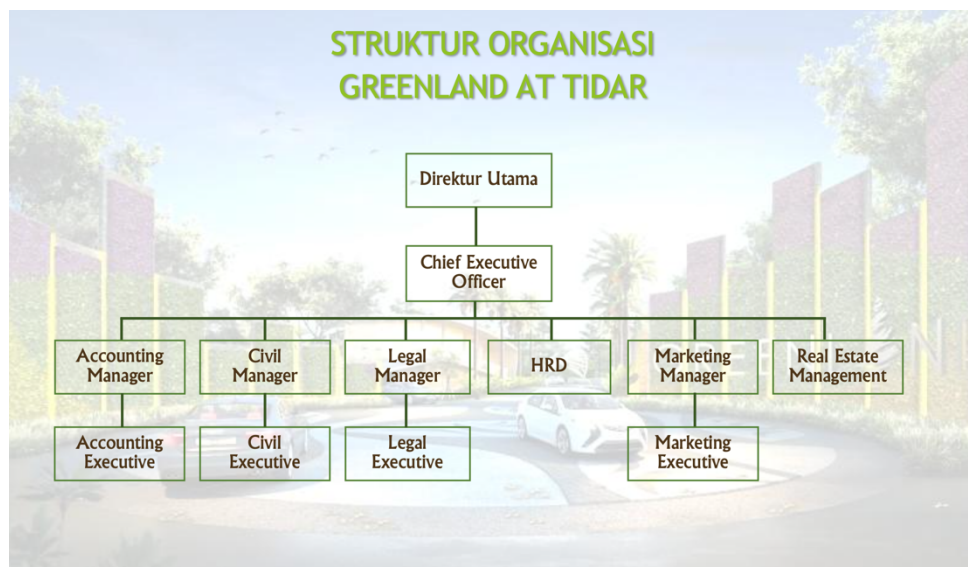
Gambar 2.6 Struktur Organisasi perusahaan