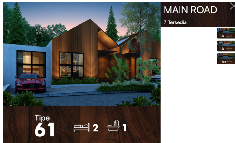
Gambar 2.9 Penampakan Produk Greenland Mainroad

Pembangunan di tahap kedua ini juga termasuk mainroad , yaitu pembangunan yang berada di jalan utama. Ada beberapa pilihan tipe rumah di mainroad . Ada luas tanah 165\text{ m}^2 memiliki beberapa tipe, yaitu tipe 135, tipe 150, dan tipe 178. Dan kedua luas tanah 174\text{ m}^2 dengan signature edition ada dua tipe rumah, yaitu tipe 80 dan tipe 150. Di bagian mainroad semua pembangunan rumah dua lantai. Khusus untuk pembangunan di mainroad design bisa menyesuaikan permintaan user atau mengikuti design bangunan dari perusahaan.