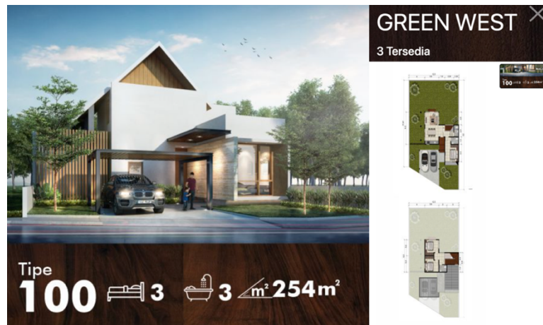
Gambar 2.7 Penampakan Produk Greenland Green West