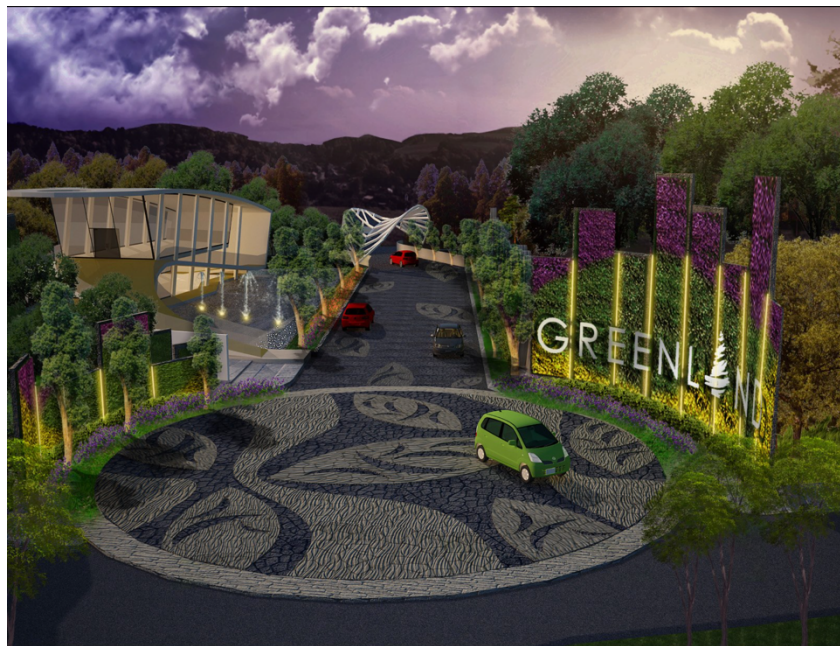
Gambar 2.1 Penampakan Gerbang Masuk Perumahan Greenland Tidar

PT Citra Argo Tirta adalah suatu perusahaan swasta nasional yang bergerak di bidang Properti Developer di kota Malang berdiri pada tanggal 4 April 2012. PT Citra Argo Tirta membangun perumahan pertamanya yaitu Greenland at Tidar yang berlokasi di Jalan Raya Candi Malang, Kelurahan Karangbesuki, Kecamatan Sukun. Di masyarakat sekitar Kota Malang memiliki anggapan bahwa perumahan Greenland merupakan perumahan elite di area tersebut. Diberi nama Greenland dikarenakan mengusung konsep yang bernuansa hijau, rindang, dan memiliki banyak pepohonan disekitarnya.