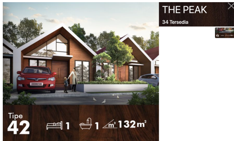
Gambar 2.11 Penampakan Produk Greenland The Peak

The Peak adalah tahap ketiga pembangunan di Greenland. Ada sekitar 63 unit rumah di cluster ini. Di the peak tersebut menawarkan beberapa pilihan tipe rumah. Dengan luas tanah 72-90 bisa memilih tipe bangunan 42 dan 49 di blok Q dan R luas tanah 112 m^2 menggunakan tipe rumah 56, 60, 65, 69. Di blok P dengan luas tanah 128-136 m^2 bisa menggunakan tipe bangunan 75 dan 85. Dan beberapa rumah pojok yang bisa free desain sesuai dengan keinginan user . Di tahap 3 ini mempunyai standar penggunaan bahan bangunan dinding kamar mandi keramik Ex Roman, kusen dari aluminium profil powder coating hitam, meja dapur terbuat dari granite pure black rangka atap galvalum, penutup atap genteng flat keramik, penutup plafon gypsum 9mm+ list , lantai R. utama / kamar tidur granite tile 60x60 cm lantai kamar mandi keramik Ex Roman, lantai teras keramik motif kayu, lantai carport concrete grass , air water treatment dan listrik PLN 1300 WATT.