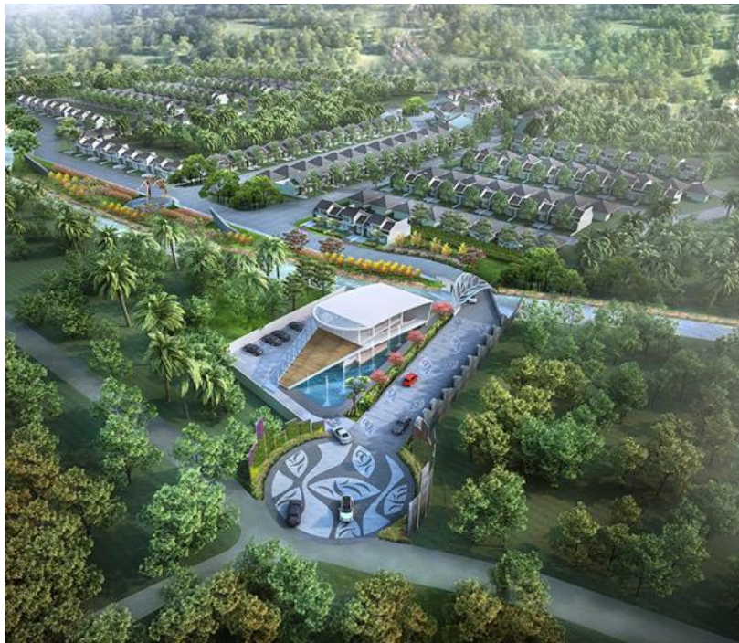
Gambar 2.3 Penampakan Atas Greenland Tidar