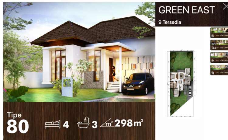
Gambar 2.8 Penampakan Produk Greenland Green East