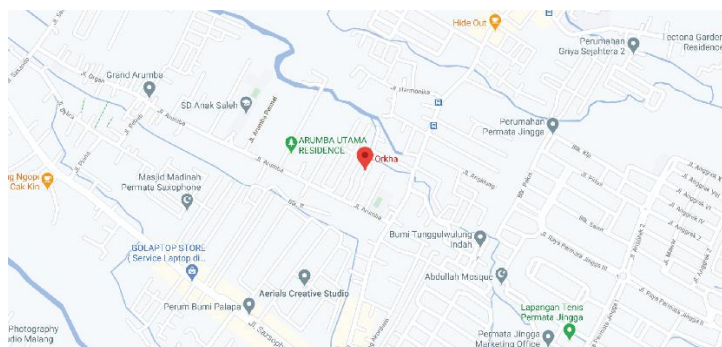
Gambar 2.2. Map Location

Orkha Studio berlokasi di Jl. Perum Arumba No.16, Tunggulwulung, Kec. Lowokwaru, Kota Malang, Jawa Timur