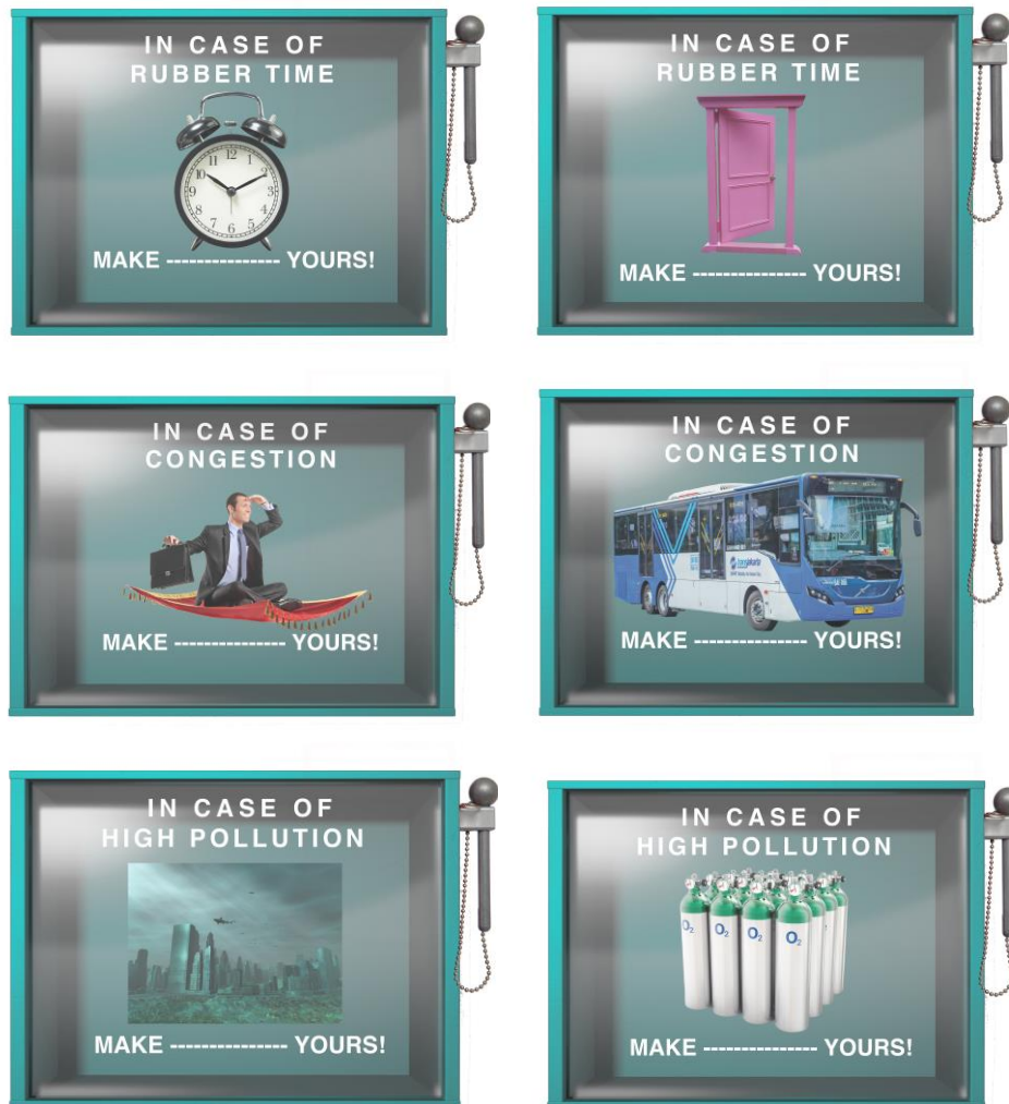
Gambar 5.2 Desain Billboard Aplikasi TMRRW

Project kedua yang dikerjakan saat Praktik Kerja Lapangan selain membuat social media post adalah pembuatan desain billboard untuk aplikasi TMRW. Aplikasi TMRW adalah layanan digital banking, dimana pada aplikasi ini memudahkan pengguna untuk menabung dan membayar tagihan, aplikasi ini juga mempunyai fitur pengingat untuk membayar tagihan tersebut.