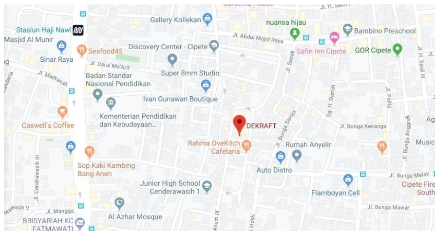
Gambar 2.2 Peta Lokasi Dekraft

Dekraft berlokasi di Jalan Abdul Majid Dalam 3 no. 5, Cipete Selatan, Cilandak, Jakarta Selatan, Jakarta 12410, Indonesia.