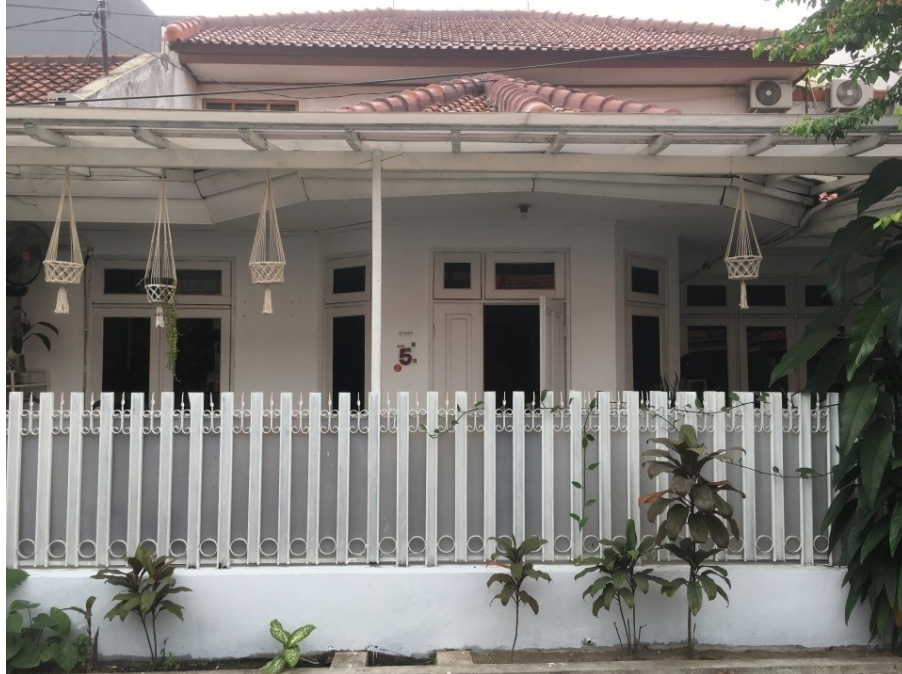
Gambar 2.4 Tampak Depan Kantor