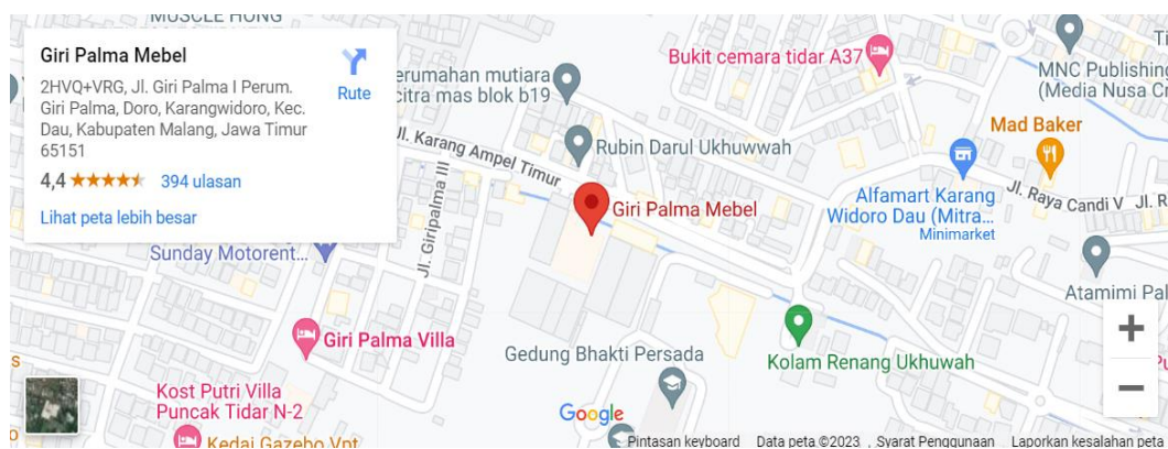
Gambar 1 Lokasi Giri Palma

Lokasi Giri Palma Mebel yang merupakan pusat giri palma berada di Giri Palma I Perum Giri Palma, Doro, Karangwidoro, Kec. Dau, Kabupaten Malang, Jawa Timur. Selain Berada di Tidar Atas Giri Palma Memiliki beberapa cabang kantor penjualan antara lain di Giri Palma Wilis, Giri Palma MOG, Giri Palma Sidoarjo.