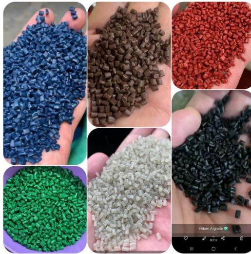
Gambar 8. PP Warna