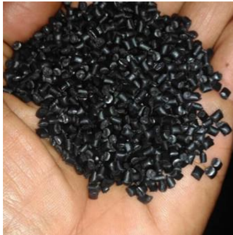
Gambar 7. PP Hitam