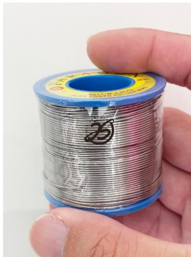
Gambar 11. Timah