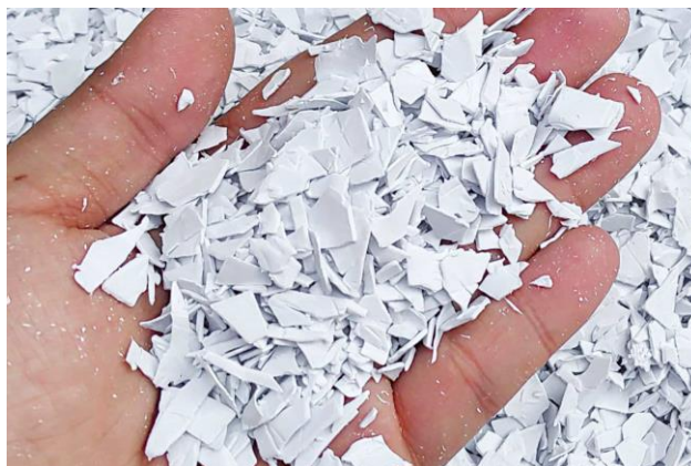
Gambar 9. PP Tembok