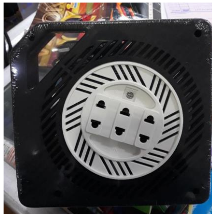
Gambar 3 Kabel Box