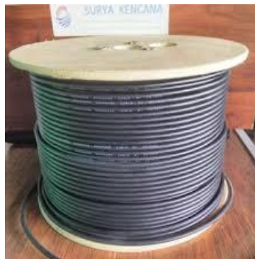
Gambar 13. Kabel rol