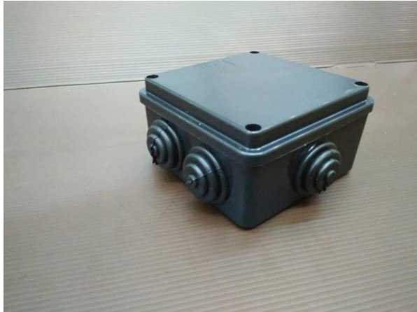
Gambar 4. Duradus