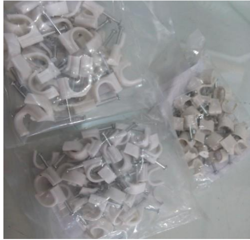
Gambar 5. Paku Kabel