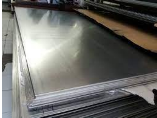
Gambar 12. Plat alumunium