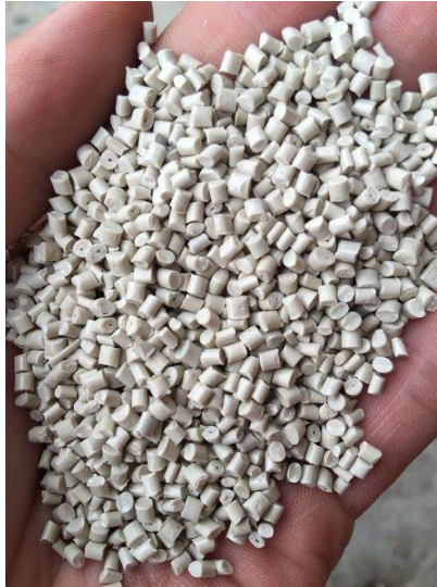
Gambar 10. HD putih