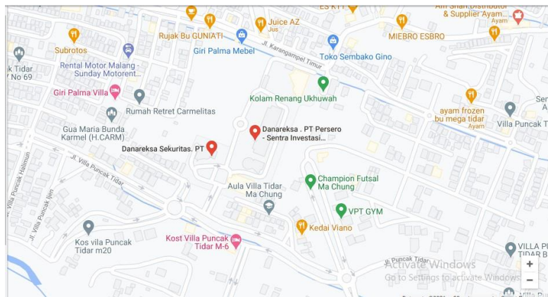
Gambar 1 Lokasi PT Danareksa Sekuritas Cabang Malang

Kantor PT Danareksa Sekuritas cabang Malang yang terletak pada lantai 2 Gedung Bhakti Persada Universitas Ma Chung, Jalan Villa Puncak Tidar N-1 Malang, Kelurahan Karangwidoro, Kecamatan Dau, Kota Malang 65151, Jawa Timur.